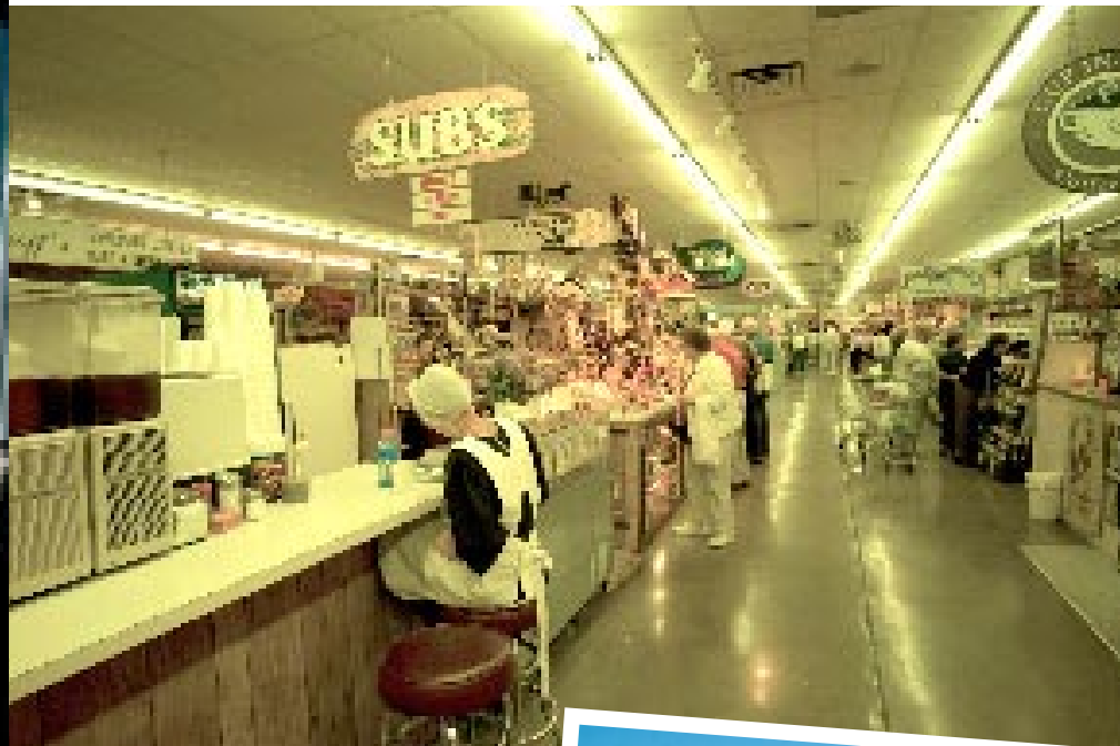
RENTABLE. Une jeune vendeuse fait les comptes des ventes de la matinée au marché d'Intercourse. Il reçoit la visite de plusieurs centaines de touristes par jour.