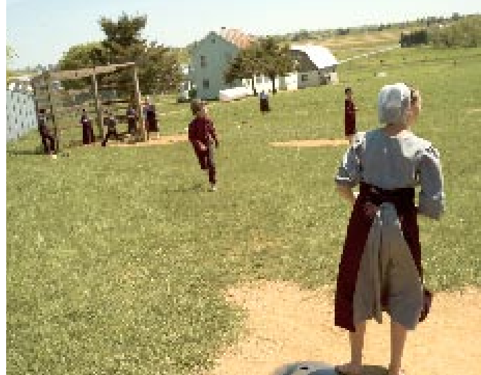
À L'ÉCOLE. Si chanter l'hymne américain en saluant le drapeau est considéré ici comme un acte d'idolâtrie, la pratique du base-ball est autorisée.