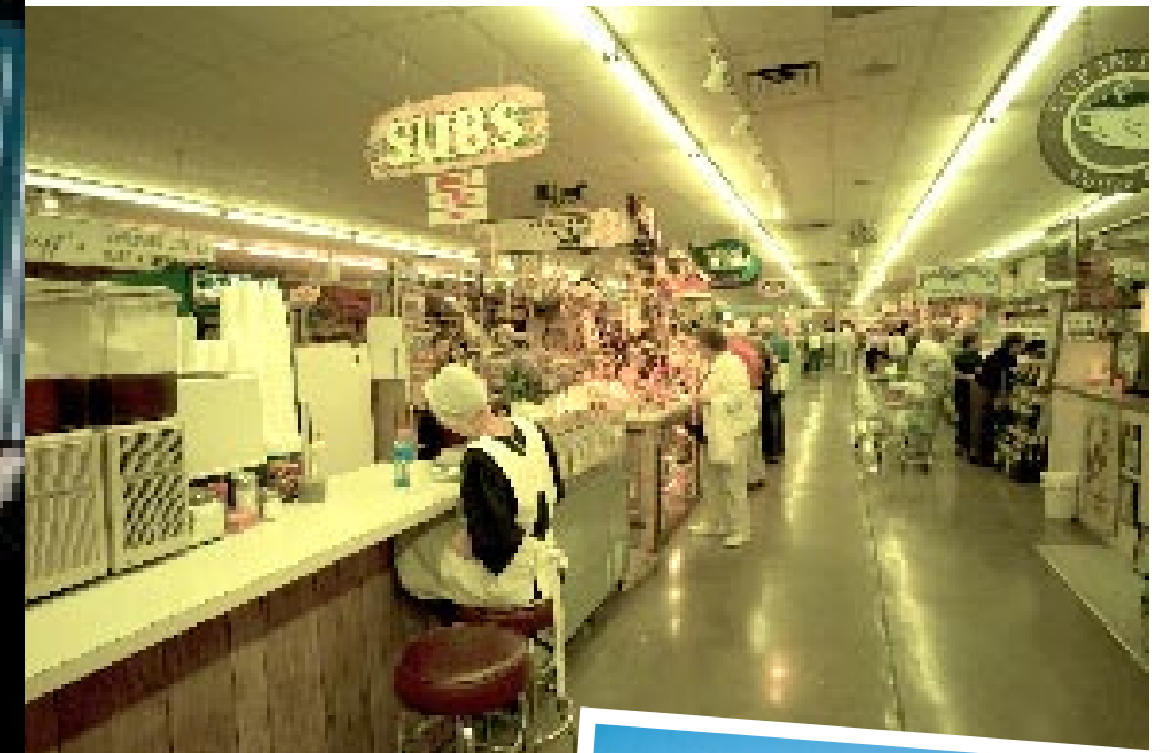
RENTABLE. Une jeune vendeuse fait les comptes des ventes de la matinée au marché d'Intercourse. Il reçoit la visite de plusieurs centaines de touristes par jour.