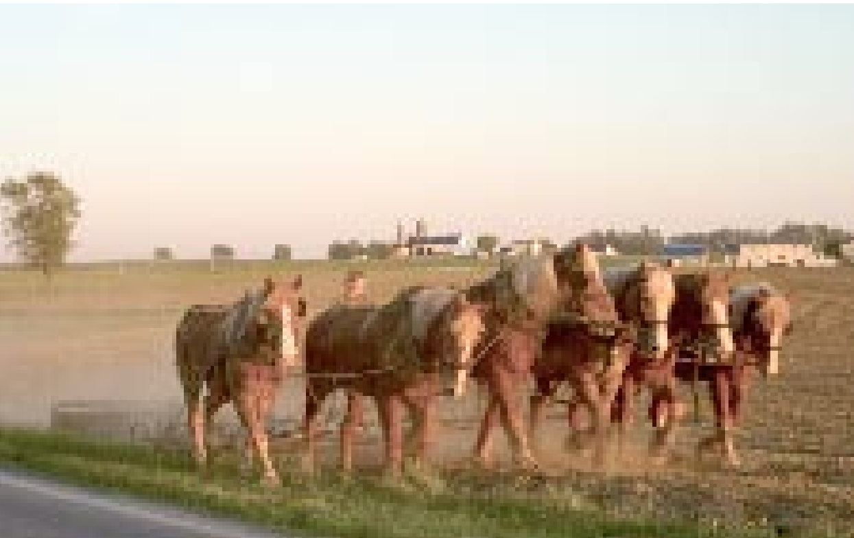
TECHNIQUES D'ANTAN. Au moment de semer du maïs, les "yaa !" pour commander les chevaux résonnent dans tout le comté. Les amish sont la cible d'associations de défense des animaux qui prônent leur remplacement par des machines.