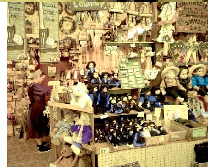
"TU NE TE FERAS PAS D'IMAGE TAILLÉE." Fidèles à ce précepte de la Bible, les amish ont des poupées sans visage. En revanche, celles qu'ils vendent aux touristes arborent de larges sourires. Business is business.

Mais les amish savent adapter l'austérité de leur foi afin de servir les valeurs du travail. Il leur est ainsi possible d'utiliser des groupes électrogènes pour produire leur électricité ou du ●●●