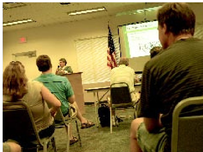
RÉUNION DES HABITANTS. Le thème de ce soir : l'histoire de Celebration. La ville est pourtant récente, puisqu'elle n'existe que depuis onze ans.

Disney survola la région pour la première fois le 22 novembre 1963 sous un nom d'emprunt pour conserver sa mission secrète. Ce même jour, Kennedy était assassiné. L'époque était à l'image de cette journée-là : débordante et imprévisible. Car