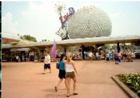
EPCOT. Ce projet de ville du futur (Experimental Prototype Community Of Tomorrow), conçu par Walt Disney, a finalement pris la forme d'un parc à thème.