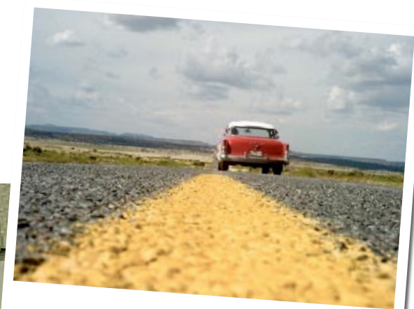
ROUTE 66. C'est par cette route mythique du pays que nos reporters ont poursuivi leur voyage. Après les Amish, Twin Oaks et Celebration, nous les retrouverons la semaine prochaine à Arcosanti, ville futuriste en plein désert de l'Arizona.